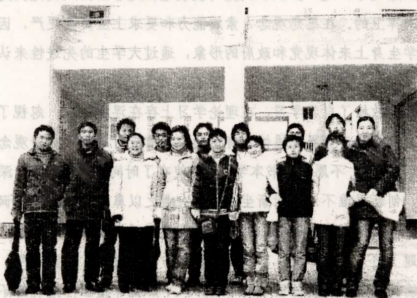
副馆长（左二） 指导老师（左四） 会长（左三） 社团主要成员